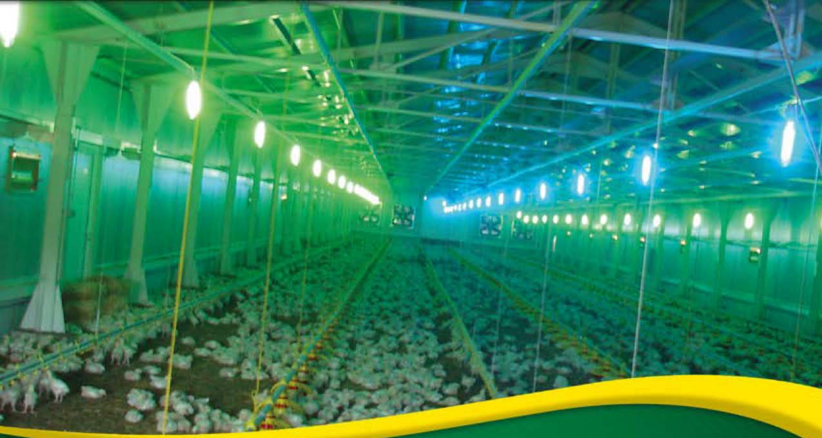
BEYAZ 900 LÜMEN