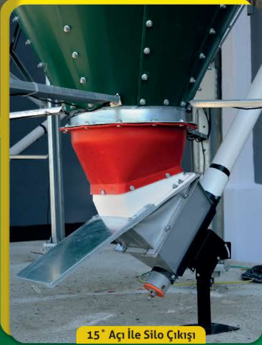
15° Açılı ile Silo Çıkışı